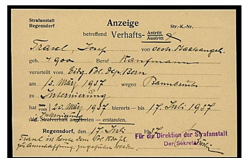
Das letzte Lebenszeichen: Die Austrittsanzeige samt Ausschaffungsbescheid, 17. Juli 1937.

Nur Tage später beschloss das EJPD, kurzen Prozess zu machen. Auf der Austrittsanzeige der Strafanstalt Regensdorf steht: «Traxl ist heute dem Pol. Kdo. Zh zur Ausschaffung zugeführt worden.» Das ist sein letztes Lebenszeichen in der Schweiz. Er wurde im nationalsozialistischen Deutschland zu einem unbekanntem Zeitpunkt verhaftet und ins KZ Buchenwald überstellt. Dort starb er am 24. August 1941.